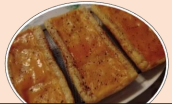
油揚げのペッパーチーズ焼き