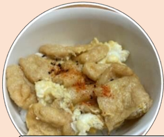
なんちゃって親子丼