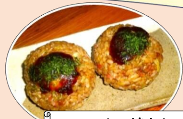
ソースたこ焼きおにぎり