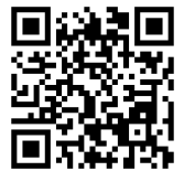
メールアドレス二次元コード