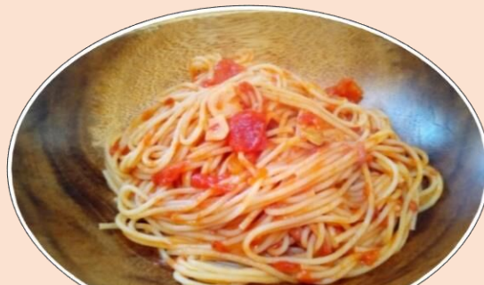
外食で一度は食べたことのある系 のトマト Pasta~梨風味~ (昨年のおとう飯得票2位!)