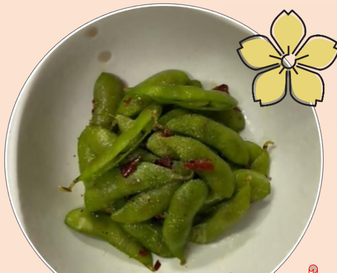
えだまめペペロン (昨年の KING OF おとう飯!)