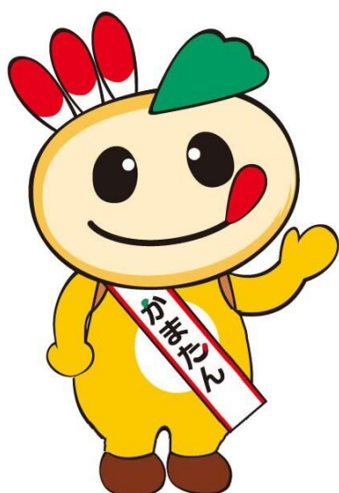
鎌ヶ谷市マスコットキャラクター かまたん