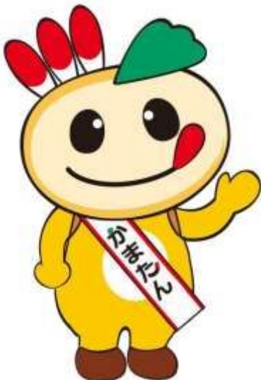
鎌ヶ谷市マスコットキャラクター かまたん