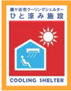
このマークが目印です!