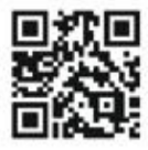
かまっこ応援団ホームページ

妊娠・出産時の手続き、保育サービス・手当・助成についてのお知らせや、各児童センターのイベントなど、さまざまな最新情報を配信しています。