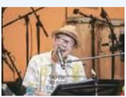
ヒトヨシノビタさん

申し込み 3月8日(金)までに申し込みフォームから/身体障がい者福祉センター ☎445・1543