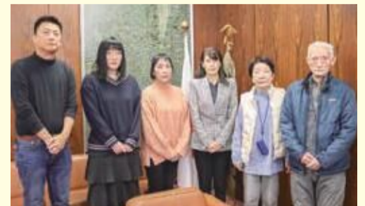
前田さんご家族と市長