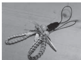
ウクライナカラーのストラップ