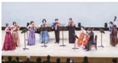
アヴァンツアーレ