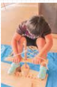
昨年度の火おこし体験