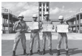
第48回消防救助技術千葉県大会に出場した隊員