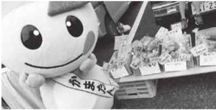
かまたんと朝市の新鮮な野菜