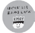
子育て子育て応援サイト「かまっこ応援団」

子育て相談に応じるコーディネーターが、市内の子育て情報や子どもと一緒に楽しめるイベントなどをママ目線で情報発信しています。