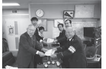
贈呈式が行われました

ランドセルカバーには、北海道日本ハムファイターズのファームマスコット「カビー・ザ・ベアー」が描かれています。