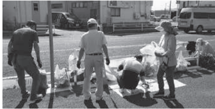
きれいなまちをつくりましょう

集められたごみの回収は、市内の建設業協会、管工会、電設協会の清掃事業協同組合、有価物資源組合などがボランティアで回収します。