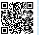
混雑状況配信サイト