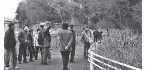
大津川沿いで早春の自然と触れ合いましょう