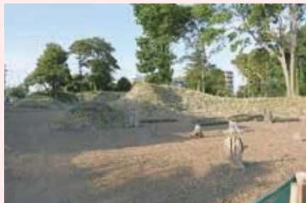
国史跡下総小金中野牧跡(捕込)

これまで継承してきた、地域の宝と言える貴重な文化財を、後世に残す仕組みづくりを進め、市民の皆さまと一緒に大切に守っていかれたらと思っています。