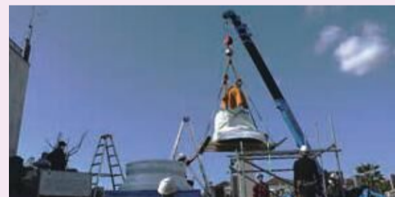
鎌ヶ谷大仏を移動している様子