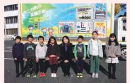
ポスターを描いた子供たちと市長

このトラックは、花王ロジスティクス株式会社様の協力により作成され、鎌ヶ谷市を含む周辺市を走行いたしますので、これから、皆さんも見かけることがあると思います。子どもたちの素晴らしい作品を見ることで、多くの方々の交通安全への関心を、さらに高めるきっかけとなることを期待しています。