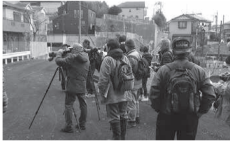
さまざまな場所から野鳥を観察します

ウォーキングをしながら、野草や野鳥を観察します。簡単な水質検査(パックテスト)も体験できます。 対 市内在住・在勤・在学の人(小学校2年生以下は保護者要同伴) 時 2月19日(日) 9時30分囃子水公園集合～12時30分市民の森解散(雨天時は2月26日(日)) 定 20人(申込先着順) 費 保険料50円 師 囃子水の自然を育てる会 持 筆記用具、双眼鏡(持っている場合)、マスク 服装 歩きやすく汚れてもよいもの 申 申し込みフォーム/環境課 ☎445・1227