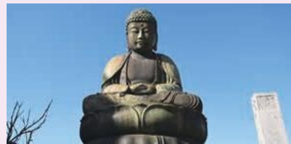
元の位置に戻った鎌ヶ谷大仏