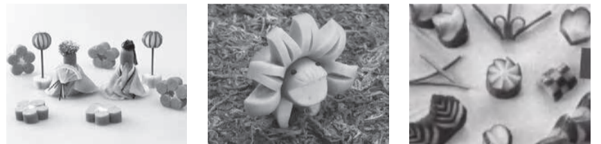
ウインナーの飾り切り(イメージ)

☑ 管理栄養士による話と飾り切りの調理実習 ☑ 2月28日(火)10時～12時 ☑ 総合福祉保健センター3階 ☑ 定24人 ☑ 師 日本ハム(株)の食育アドバイザー ☑ 持筆記用具・マスク・飲み物・エプロン・布巾2枚 ☑ 保育 未就学児、先着5人(2月21日(火)までに要予約) ☑ 他 まなびい100対象 ☎445・1546