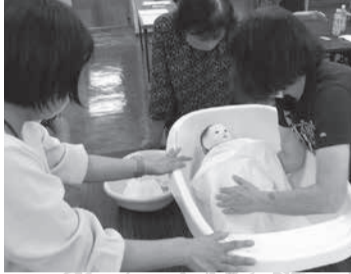
活動に役立つ研修会・交流会

申し込み 市社会福祉協議会(総合福祉保健センター5階)窓口/☎444・2231/☎446・4545