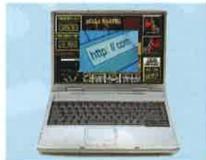
↑インターネット販売

危険ドラッグ は、「ハーブ」「お香」などとあたかも安全なもののように偽って販売されている薬物で、決して「安全」でも「合法」でもありません。危険ドラッグを使用して呼吸困難になった例や死亡した例もあります。