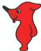
千葉県マスコット キャラクター 「チーバくん」

健康福祉部 薬務課ホームページ http://www.pref.chiba.lg.jp/yakumu/index.html