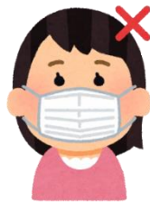
顎まで覆われていない