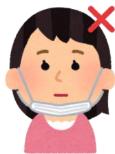
マスクを顎まで下げる

マスクを顎まで下げたり、鼻を出したりするとマスクを利用した十分な感染予防にはなりません。正しくマスクを着用しましょう。