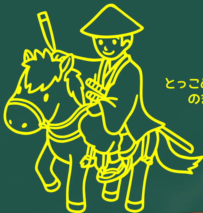
とっこめくん & のまっきー