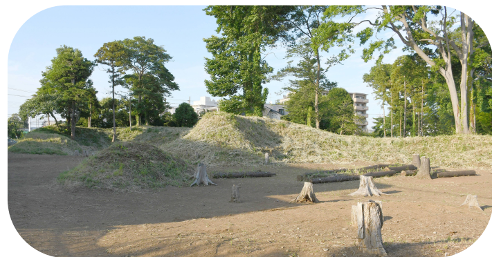
捕込(とっこめ)の様子

東中沢にある「 捕込 (とっこめ)」と、初富小学校校庭横にある「 野馬土手 (のまどて)」は、江戸幕府の軍事力を支えた軍馬生産の様相を知るうえで極めて貴重な遺跡であるため、平成19年2月6日、「 国史跡下総小金中野牧跡 」として、牧関連としては初の国史跡に指定されました。