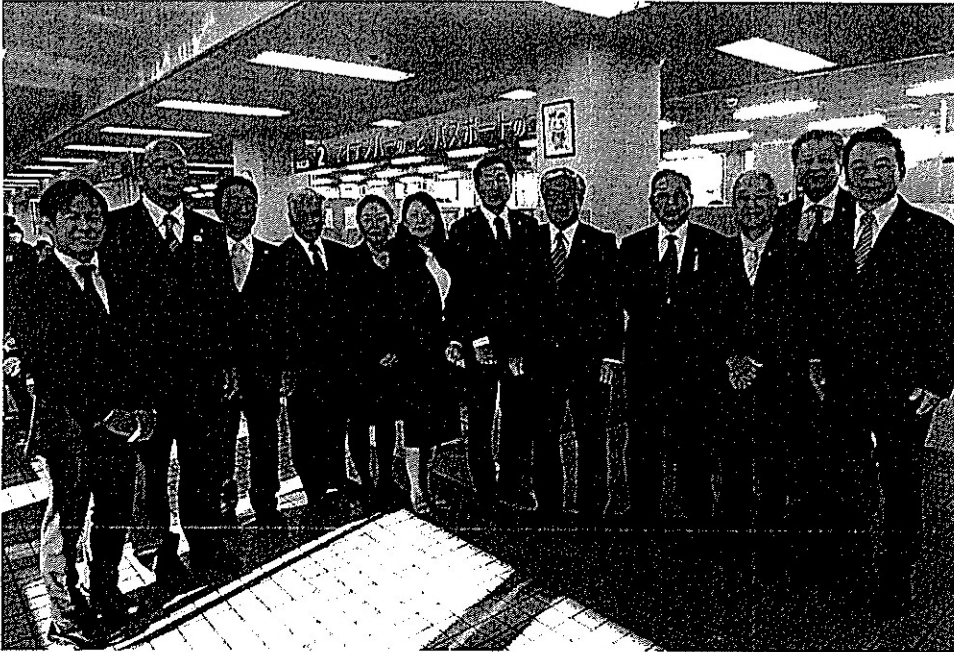
一致団結 新しい年に、より良い市民サービスの実現を誓う政友会メンバー (市役所1階のパスポート申請・受け取り窓口前で)