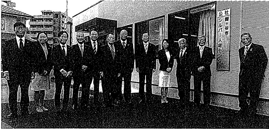
住み良い街づくりを目指す政友会(新築された鎌ヶ谷市シルバー人材センター前で)