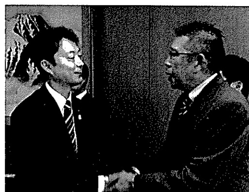
写真右：熊谷俊人千葉市長と街づくりについて語り合う