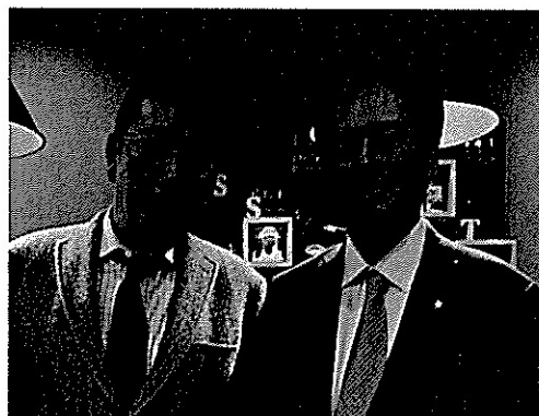
写真左：保坂展人世田谷区長に、世田谷の街づくりについて伺う

多くの皆様と、魅力ある街づくりについて語り合いたいので、ぜひお声をかけてください。