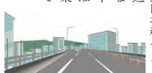
北千葉道路の建設イメージ図

○ 市街化調整区域の土地利用方針を策定する目的を伺います。 ○ 北千葉道路の整備など、市への影響が大きいインフラ整備を控える中で、市街化調整区域の現況や立地、社会ニーズなど、各区域の実情に応じた適切な土地利用を方向づけることを目的としています。 ○ 北千葉道路・IC等のポテンシャルを生かした4つのエリアにおける主な立地誘導施設・機能を伺います。 ○ 新鎌ヶ谷駅周辺西側地区は、住宅・商業・本社オフィスなどです。（仮称）鎌ヶ谷東IC周辺は、道の駅・大規模施設園芸等の農業生産機能などです。（仮称）鎌ヶ谷西IC周辺、都市計画道路3・1・2号栗野田境線エリアは物流・情報通信・製造業などです。北千葉道路沿道は商業・流通業務機能などです。