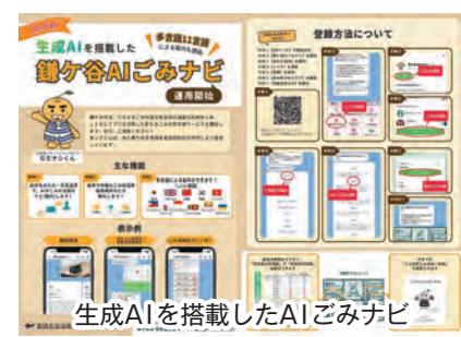
生成AIを搭載したAIごみナビ

○ デジタル化の推進について、市の基本的な考え方を伺います。 ○ 少子高齢化や労働力不足等の社会課題に対応し、持続可能な行政運営を図るためDX基本方針を策定しました。本方針ではDX推進環境の整備、市役所業務の効率化、市民の利便性向上の3つの取組領域を定め、バランスの取れた施策を推進します。 ○ 市のビジョンと今後の展開を伺います。 ○ ビジョンとして一人ひとりの便利で快適を支えるまちを掲げ、DXを推進していきます。具体的には各課1名程度の推進リーダーの育成、契約書類の作成等を自動化する契約管理システムの導入、保育園業務のデジタル化のほか書かない窓口やオンラインで完結できる行政手続きの整備などにより業務の効率化と市民の利便性向上を目指します。