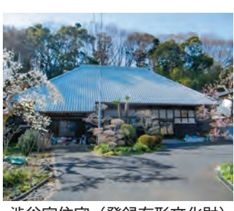
澁谷家住宅（登録有形文化財）

○ 市内に点在する文化財について、文化庁が進める日本遺産のような視点を取り入れた的な観光展開に関する見解を伺います。 ○ 市内の遺跡などを中心として、今後は面的な広がりを意識した散策コースの検討、マップや案内看板の作成など文化財を観光につなげる取組 ○ 近隣市にも点在する野馬土手関連施設を近隣自治体と連携した広域ネットワーク化などが大切だと思いますが、観光周遊の視点としての考え方を伺います。 ○ 点在する野馬土手を線で結ぶような観光周遊の視点は文化財を観光資源として考える実施を考えています。