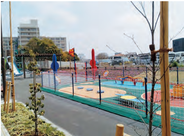
北初富ほほえみ公園が開園しました（4月8日）