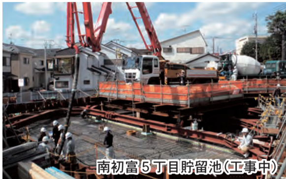
南初富5丁目貯留池(工事中)