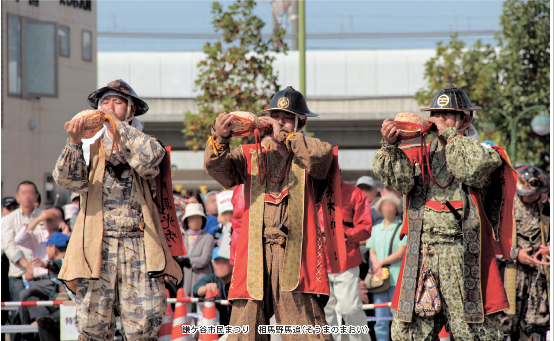
鎌ヶ谷市民まつり 相馬野馬追(そうまのまおい)

発行 鎌ヶ谷市議会 編集 議会だより編集委員会 〒273-0195 鎌ヶ谷市新鎌ヶ谷二丁目6番1号 電話 047(445)1191(直通) メール:gikaisyomu@city.kamagaya.chiba.jp