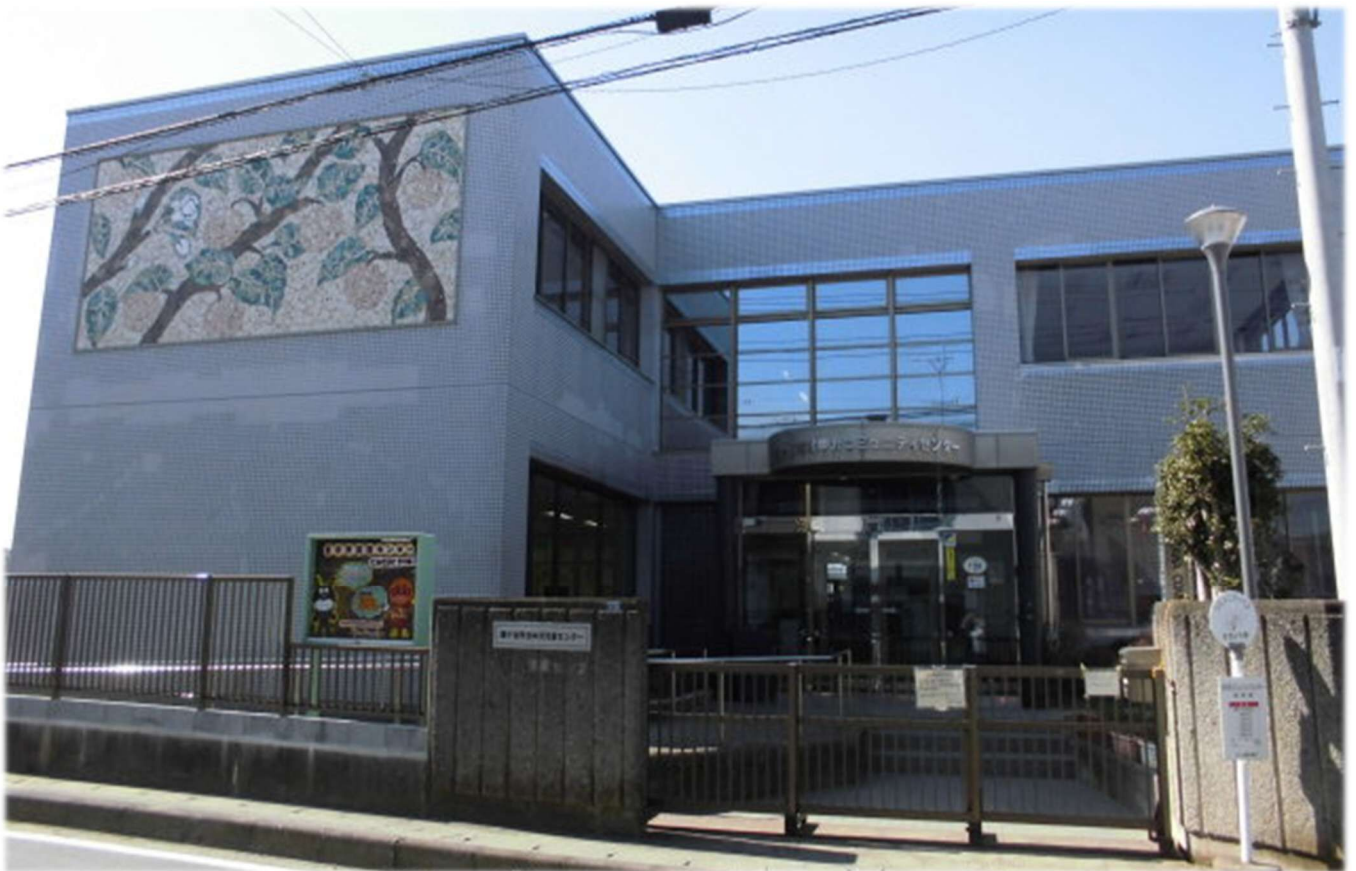
写真：北中沢コミュニティセンター

コミュニティセンターは、市民の自主的な活動の場を確保し、もって市民相互の交流を深め、人間性豊かな地域社会の形成を図るとともに、市民福祉の増進と文化の向上を図るための施設です。