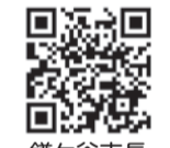
鎌ヶ谷市長公式チャンネル