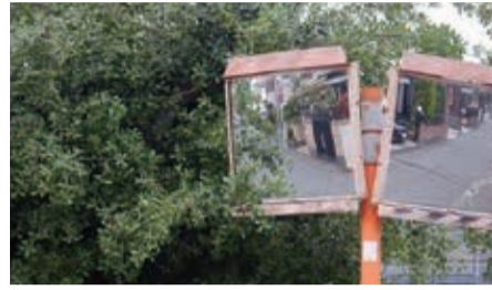
枝や葉がカーブミラーにかかると危険です

生け垣や庭木の枝が道路にはみ出していると、通行を妨げたり見通しを悪くしたり、思わぬ事故を誘発する恐れがあり危険です。土地の管理者は、枝などが道路にはみ出さないよう剪定(せんてい)などを行い、適正に管理しましょう。 問 道路河川管理課☎445・1453