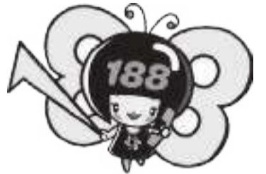
消費者庁消費者ホットライン188 イメージキャラクター「イヤヤン」