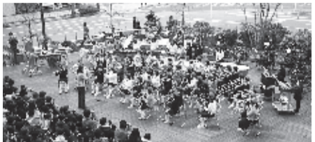
今年で20回目を迎える恒例イベント

内 ●小・中・高校生と地域の人たちによる吹奏楽演奏 ●コーラスグループの合唱 ●ファイターズ選手によるサイン会 ●お楽しみ抽選会 など 時 12月22日(日) 11時から(雨天中止) 所 鎌ヶ谷駅東口駅前広場 問 鎌ヶ谷駅前ふるさとづくり推進協議会 ☎498・6111