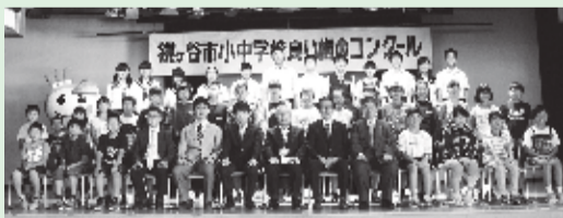
38人が表彰状を授与されました