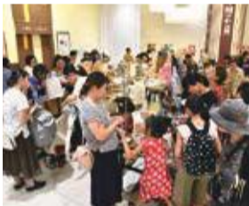
約40団体が参加します