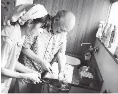
本人の介護状態に合わせ、見守りやサポートを行います