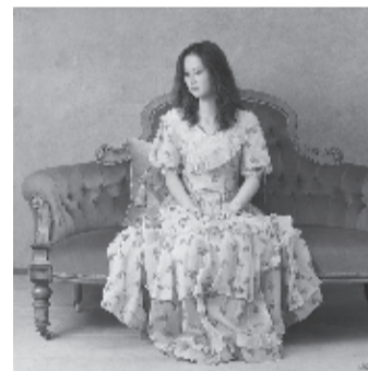
▲森本草介「アンティーク・ドール」 2012年 ホキ美術館