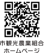
市観光農業組合ホームページ