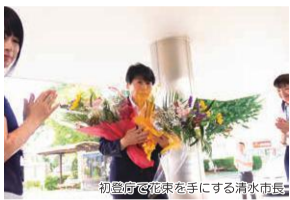
初登庁で花束を手にする清水市長

去る7月8日に行われた市長選挙において、多くの市民の皆様のご支持をいただき、これからの4年間も引き続き市政運営を担わせていただくことになりました。