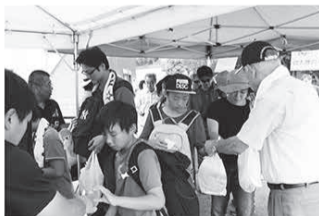
鎌ヶ谷の梨をプレゼント

配布場所 くぬぎ山・北中沢・栗野コミュニティセンター、まなびいプラザ、学習センター(各公民館)、福太郎アリーナ、弓道場・アーチェリー場、文化・スポーツ課窓口(市役所5階)