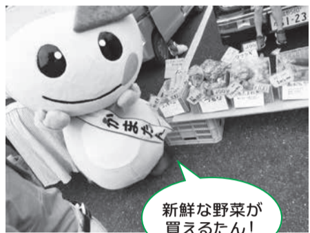
新鮮な野菜が買えるたん!

時 毎週(土)7時から(売り切れ次第終了) 所 市役所駐車場 問 鎌ヶ谷市朝市組合事務局(JAとうかつ中央鎌ヶ谷支店内) ☎443・4010