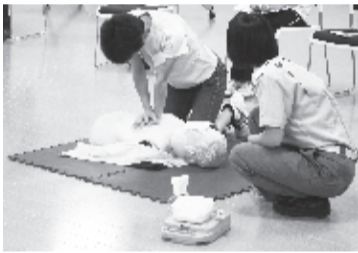
救える命をあなたの勇気で!

成人・小児・乳児の心肺蘇生法、AEDの取り扱いなど。 対 中学生以上 時 5月19日(土) 9時~17時 所 消防本部 定 20人(申込先着順) 持 筆記用具・昼食・上級救命講習修了証(再講習の場合) 申 中央消防署 ☎444・3222 問 消防本部警防課 ☎440・8125