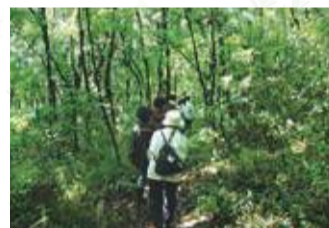
新緑の中を歩いてみませんか?