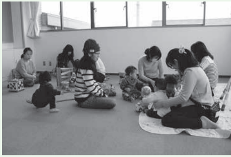
保護者同士で自然と会話が弾みます