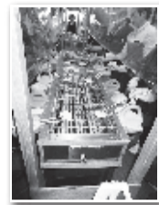
◀ 昨年の煎餅焼き体験の様子