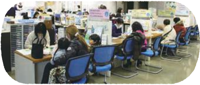
子育て世代包括支援センター窓口(総合福祉保健センター2階)