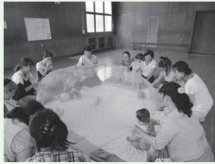
いろいろな遊びの設定をしています

児童センターでは、誰でも気軽に参加できる広場・サロンを開催しています。おもちゃや遊具で自由に遊ばせながら、お母さん同士で子育ての悩みをおしゃべりしたり、情報交換をしたりすることができます。また、保育士や子育てアドバイザーがいるので子育てに関する相談もできます。