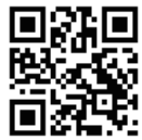
市民まつりホームページ