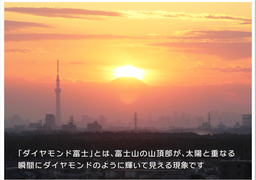
「ダイヤモンド富士」とは、富士山の山頂部分が、太陽と重なる瞬間にダイヤモンドのように輝いて見える現象です

市役所の西側は大きな建造物が少なく見通しが良いため、富士山と一緒に東京スカイツリーを展望することができます。