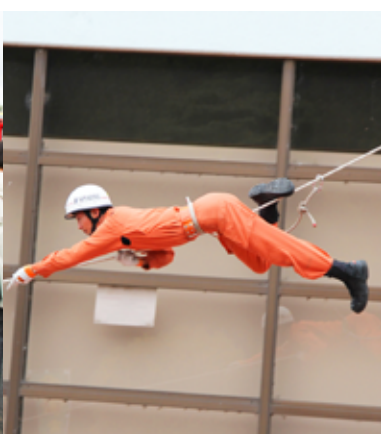
▲特別救助演習訓練