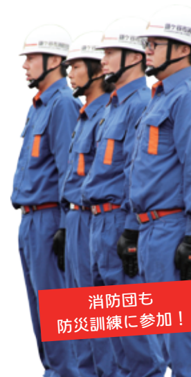
消防団も 防災訓練に参加！