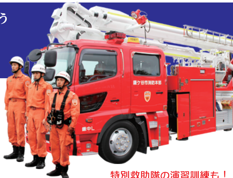
特別救助隊の演習訓練も！