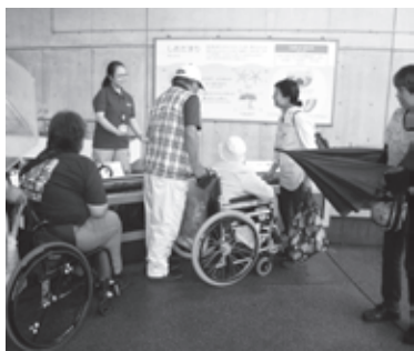
昨年は葛西臨海公園に行きました