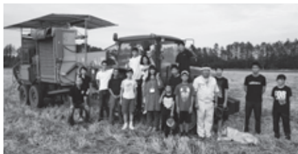
巨大なトラクターの前で