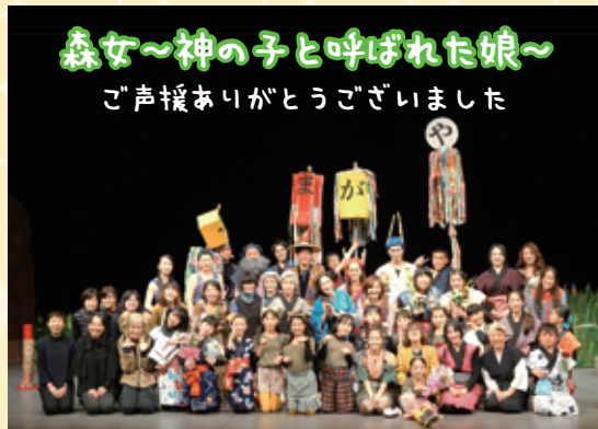
森女〜神の子と呼ばれた娘〜 ご声援ありがとうございました

また、観客からは「皆さんの熱演に感動」「内容も演技も音楽も大変素晴らしかった」などの声が寄せられ、大好評でした。