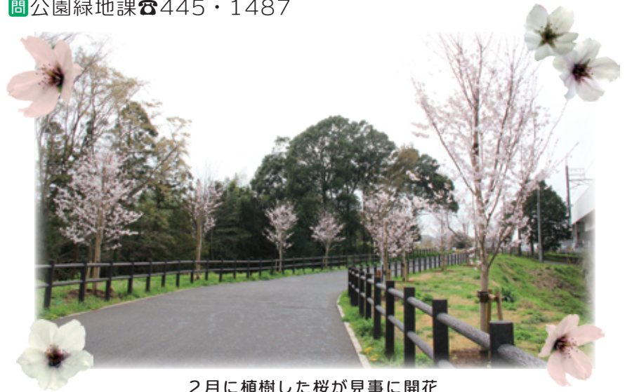
2月に植樹した桜が見事に開花