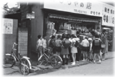
おもちゃ店に集まる小学生たち(昭和44年)

問郷土資料館 ☎445・1030 / ✉kyodo@city.kamagaya.chiba.jp