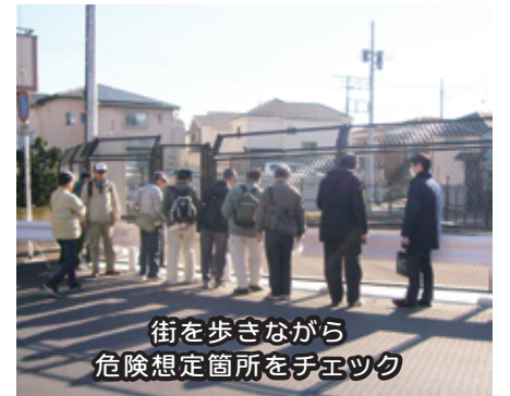
街を歩きながら危険想定箇所をチェック