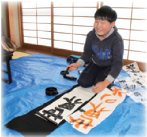
くぬぎ山児童センター こども体験教室 「書道・書きぞめをかいてみよう！」