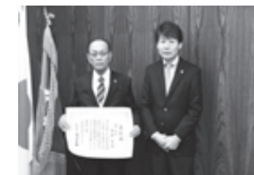
11月25日に行われた報告式