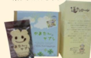
道野辺ロール・ かまたんサブレ