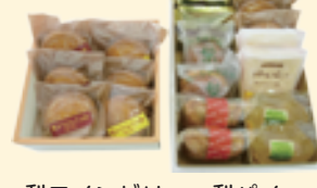
梨ワインゼリー・梨パイ・ ケーキやさんの梨・ 梨ようかんさぶれ