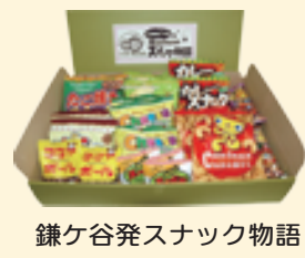
鎌ヶ谷発スナック物語