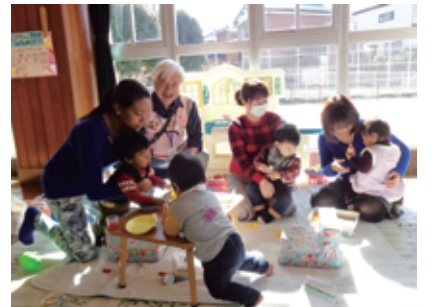
いつもにぎやかな子育てサロン