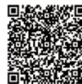
Android端末をお持ちの人