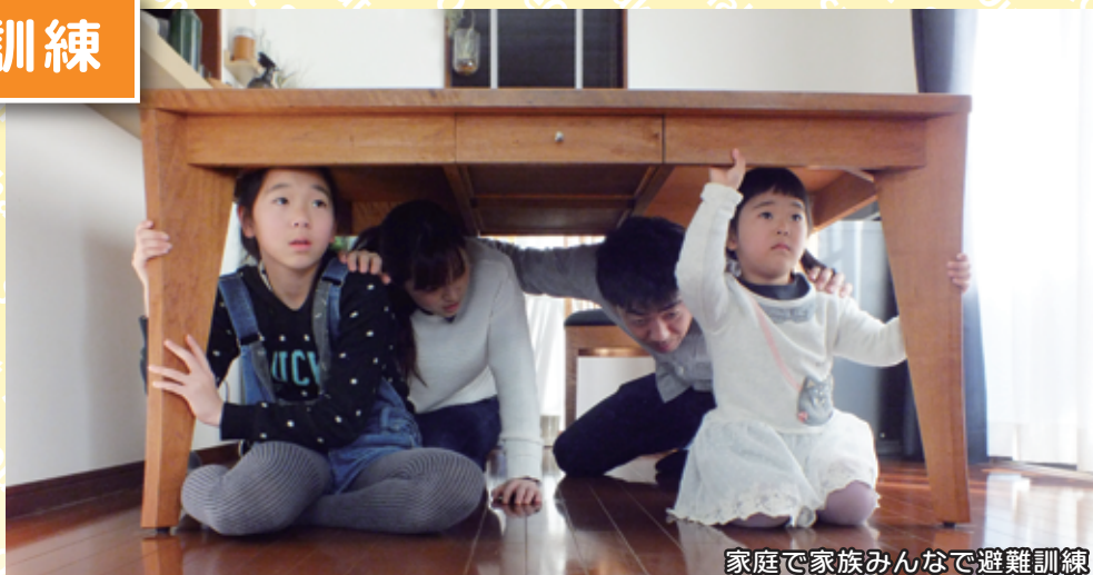
家庭で家族みんなで避難訓練