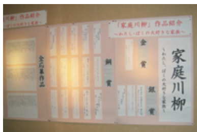
「家庭川柳」の展示(例)