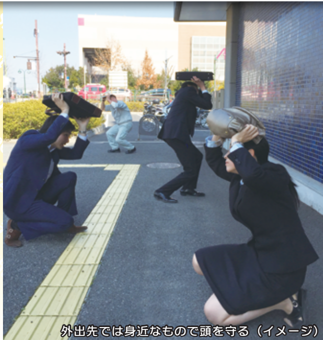
外出先では身近なもので頭を守る(イメージ)