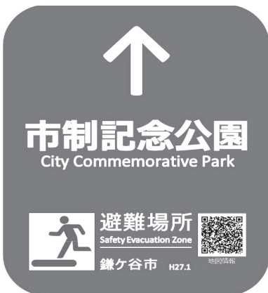
避難場所誘導看板