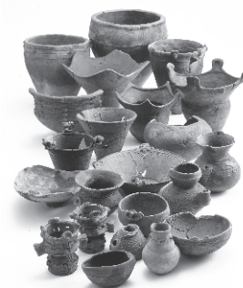
中沢地区は遺跡の宝庫です