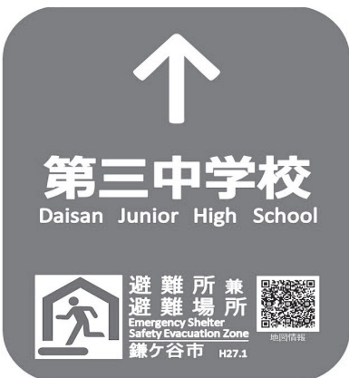
避難所兼避難場所誘導看板