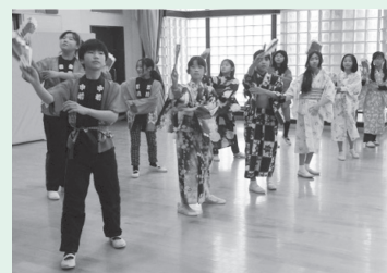
中部小学校有志による「おしやらく踊り」(昨年)

出演 時 ●南部小学校ブラスバンド部＝10時～10時20分 ●中部小学校マジッククラブ＝12時50分～13時10分