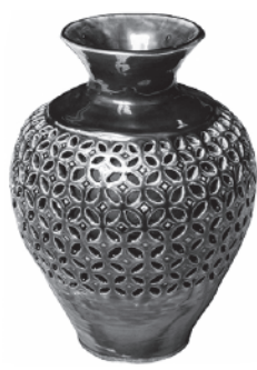
昨年度受賞作品 市展賞(工芸) 勝又 功「透彫花器」