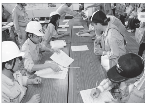
市総合防災訓練での避難所受け付けの様子

●国民健康保険が使えるもの ●日常生活からくる疲れ、体調不良、肩こり ●仕事やスポーツによる筋肉疲労 ●マッサージ代わりの漫然とした利用 ●症状の改善がみられない長期の施術