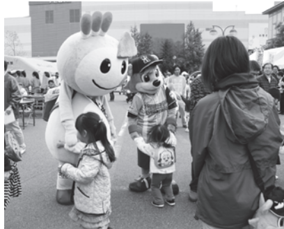
昨年のしんかま秋まつり&消防広場