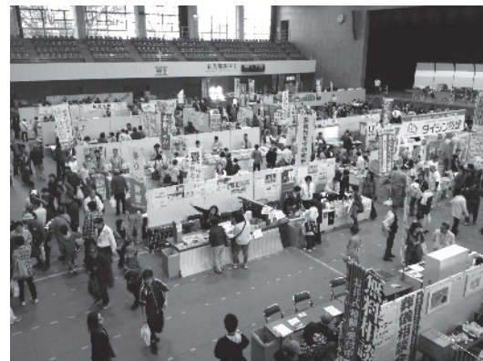
産業フェスティバル