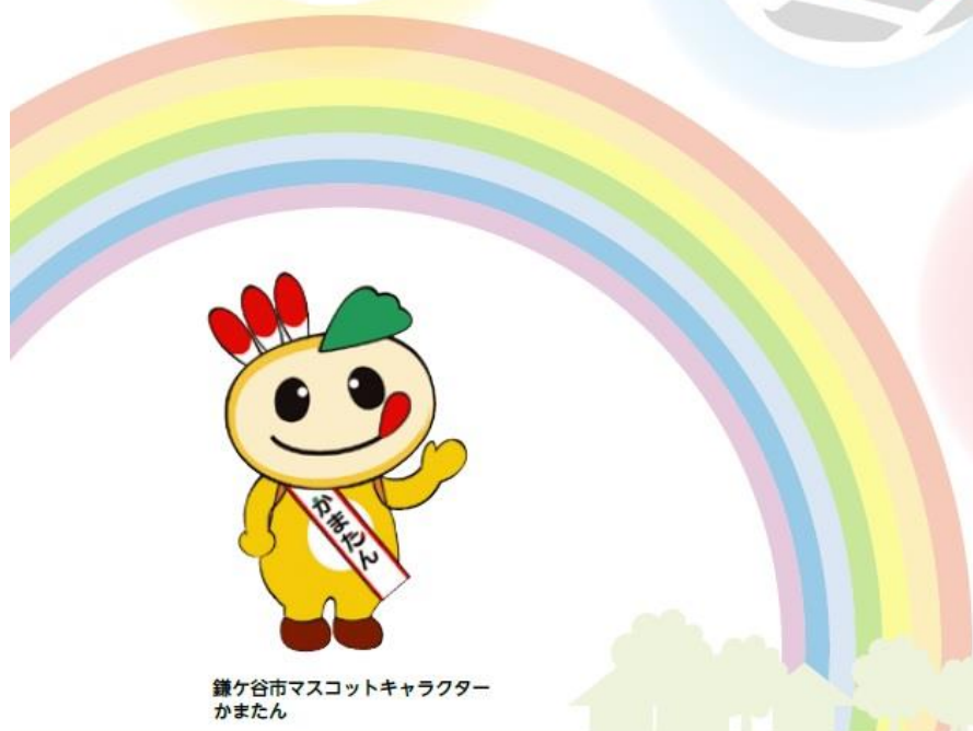
鎌ヶ谷市マスコットキャラクター かまたん