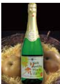
「梨スパークリングワイン」