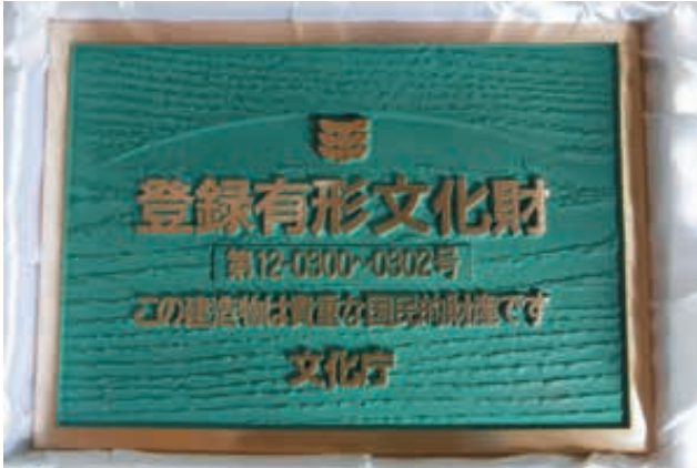
市内にある澁谷家住宅の主屋、米蔵、門と丸屋、丸屋離れの建造物5件が、令和2年8月17日に国の登録有形文化財に登録されました。写真は、澁谷家住宅になります。