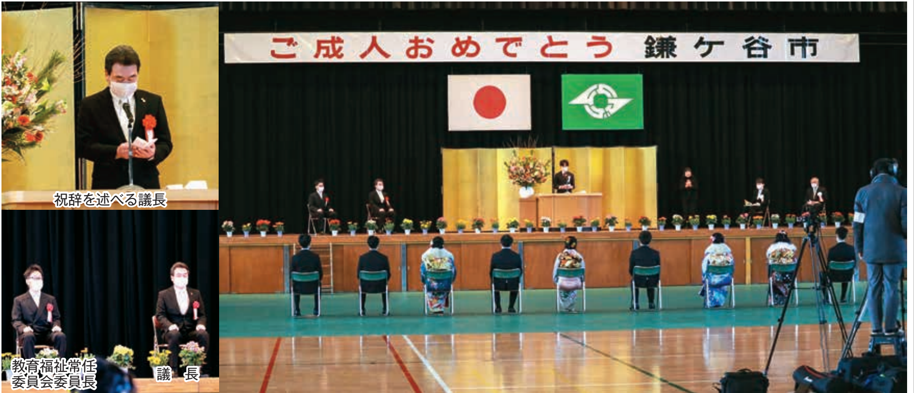
祝辞を述べる議長