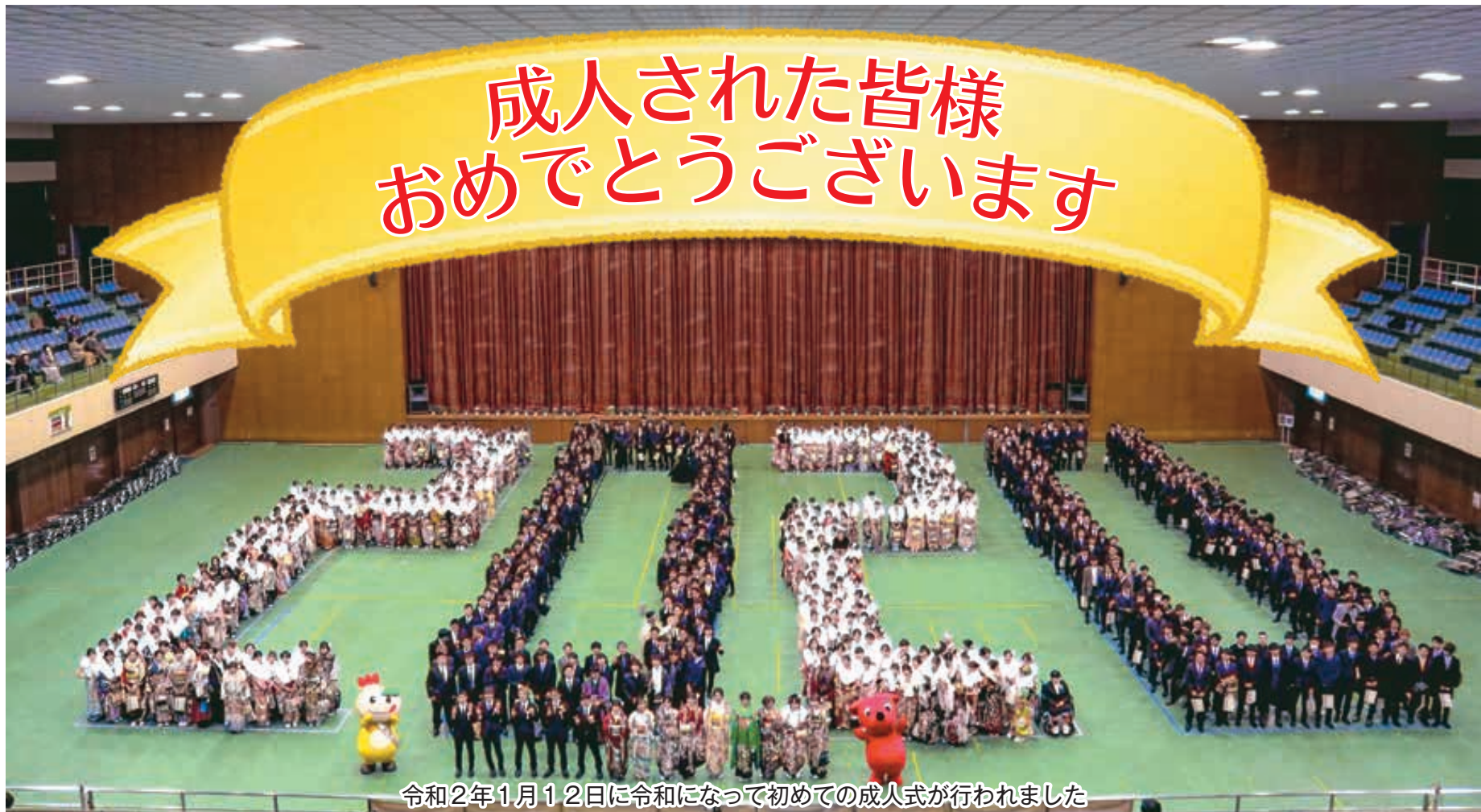
令和2年1月12日に令和になって初めての成人式が行われました

発行 鎌ヶ谷市議会 編集 議会だより編集委員会 〒273-0195 鎌ヶ谷市新鎌ヶ谷二丁目6番1号 電話 047(445)1191 (直通) FAX 047(445)2053