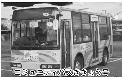
コミュニティバスきぎょう号

問 運行見直し後の利用実態調査について見解を伺います。 答 コミュニティバスに関する満足度として、回答された方の約84%の方から70点以上の評価をいただきました。また、「本数がふえてよかった。土日でも走るようになって助かる。」など、多くの方々に喜んでいただいております。運行見直しの目的は達成できました。 問 日頃より安全運転には特段の配慮をお願いしているように感じます。 答 歩道がなく路側帯などに標識が置かれ、危険と思われるバス停は全体で何カ所あります。