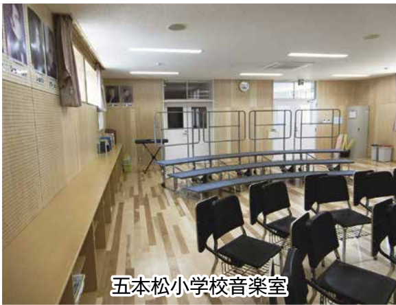
五本松小学校音楽室