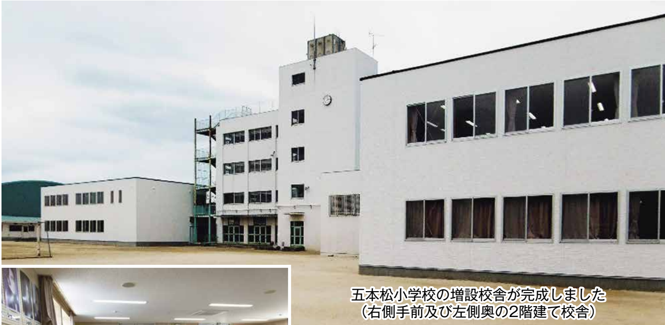
五本松小学校の増設校舎が完成しました (右側手前及び左側奥の2階建て校舎)

発行 鎌ヶ谷市議会 編集 議会だより編集委員会 〒273-0195 鎌ヶ谷市新鎌ヶ谷二丁目6番1号 電話 047(445)1191(直通) FAX 047(445)2053 メール gikaisyomu@city.kamagaya.chiba.jp