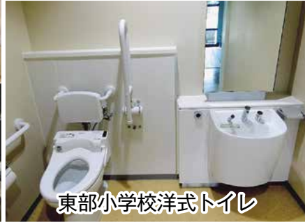
東部小学校洋式トイレ