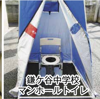
鎌ヶ谷中学校 マンホールトイレ